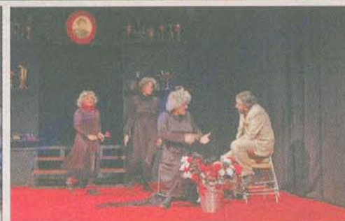
OBRAS. El jardín de los cerezos, Mulher asfalto y Lomenaje de Cirulaxia.